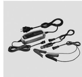
Batterieladegerät mit Ladeerhaltungsfunktion, 5A