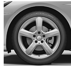
43,2 cm (17") Leichtmetallräder im 5-Speichen-Design (37R)/ Winter-Komplettäder M+S (1R5)