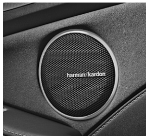
Harman Kardon® Logic7® Surround-Soundsystem (810)