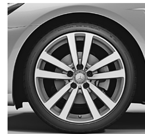
45,7 cm (18") Leichtmetallräder im 5-Doppelspeichen-Design (35R)