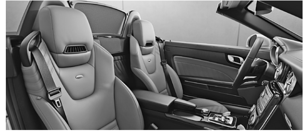
designo Leder Nappa sand/schwarz (X10)