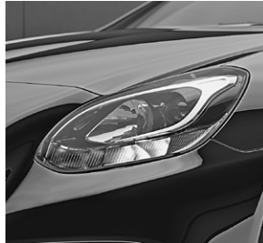
Hauptscheinwerfer in H7 Projektionstechnik mit integriertem Tagfahrlicht