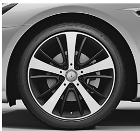
45,7 cm (18") Leichtmetallräder im 5-Dreifachspeichen-Design, (47R)