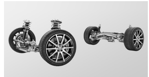
AMG RIDE CONTROL Sportfahrwerk (483)