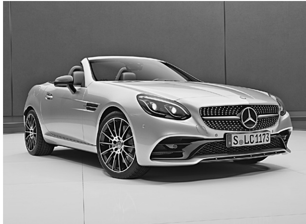
SLC 300 (Frontansicht)