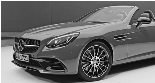
AMG Night-Paket (P60)