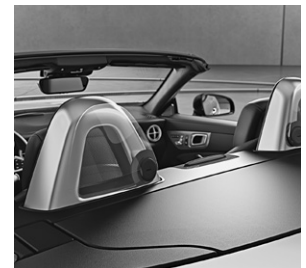
AIRGUIDE und Überrollbügel mit Einleger Aluminium eloxiert (283+B15)