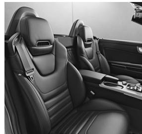
Sitze mit Sportgrafik