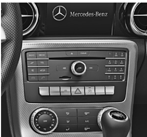
Audio 20 CD (505)