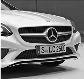
Diamantgrill schwarz mit Lamelle in Iridiumsilber und Chromauflage