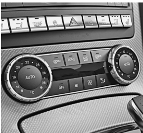
Klimatisierungsautomatik THERMOTRONIC (581)