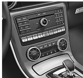
Zierelemente Aluminium mit Carbonschliff dunkel (H74)