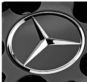
Radnabenabdeckung, Stern erhaben