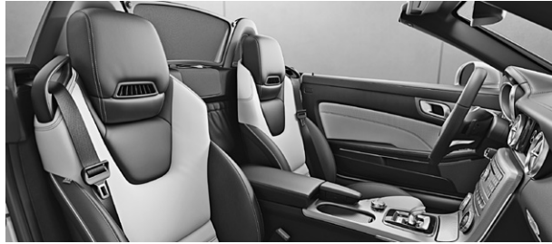
Leder Exklusiv Nappa zweifarbig platinweiß pearl/schwarz (565A)