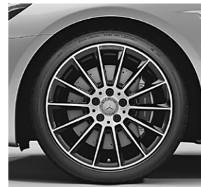
45,7 cm (18") AMG Leichtmetallräder im Vielspeichen-Design (91R)