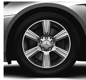
40,6 cm (16") Leichtmetallrad im 6-Speichen-Design