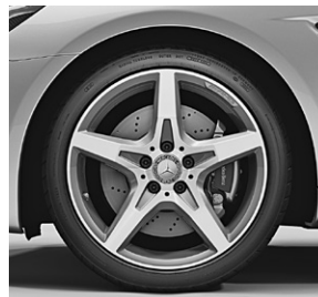
45,7 cm (18") AMG Leichtmetallräder im 5-Speichen-Design, titangrau lackiert und glanzgedreht (792)