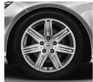
40,6 cm (16") Leichtmetallrad im 7-Speichen-Design