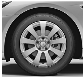
40,6 cm (16") Leichtmetallräder im 9-Speichen-Design (R12)