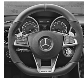
AMG Performance Lenkrad in Leder Nappa/Mikrofaser DINAMICA (L6K)