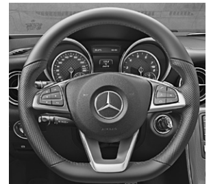
Multifunktions-Sportlenkrad in Leder Nappa (L5C)