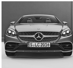
Diamantgrill in Hochglanzchrom mit Lamelle in Iridiumsilber und Chromauflage