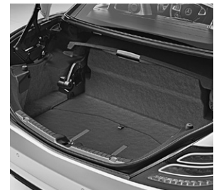
Wendeboden im Kofferraum