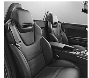
Leder Nappa/Mikrofaser DINAMICA schwarz (751)