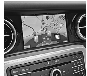
Garmin® MAP PILOT (357)