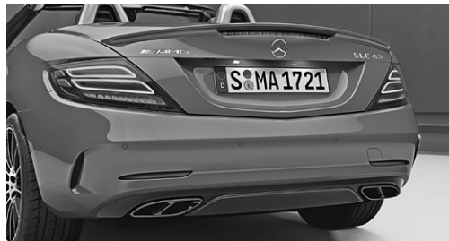
AMG Night-Paket (P60)