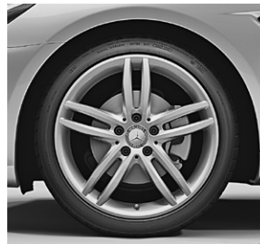
45,7 cm (18") Leichtmetallräder im 5-Doppelspeichen-Design (R70)