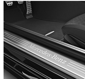
Einstiegsleisten mit »Mercedes-Benz« Schriftzug