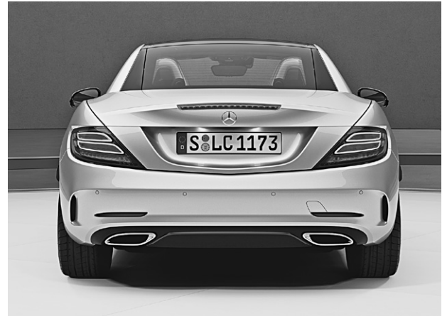
SLC 300 (Heckansicht)