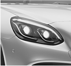
LED Intelligent Light System (642)