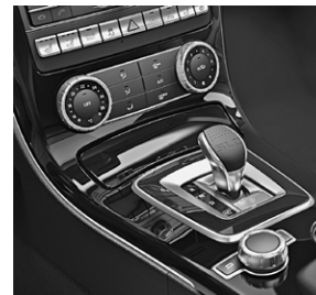
designo Zierelemente in Klavierlack schwarz (W69)