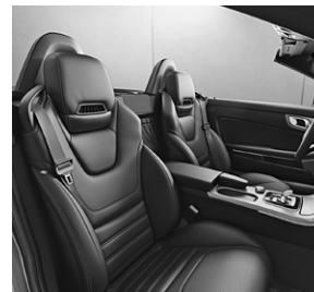
Sitze mit Sportgrafik