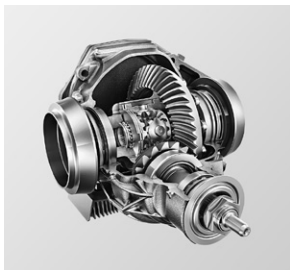
AMG Hinterachs-Sperrdifferenzial mechanisch (471)