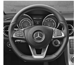
Multifunktions-Sportlenkrad in Leder Nappa (L5C)