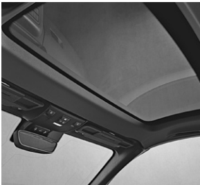
Panorama-Variodach mit MAGIC SKY CONTROL (412)