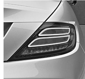
Heckleuchten in LED-Technik