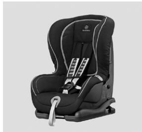
Kindersitz DUO plus, mit ISOFIX