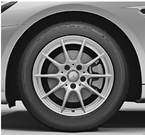
40,6 cm (16") Leichtmetallräder im 10-Speichen-Design (39R) (Serie SLC 180)