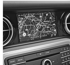
COMAND Online (531)