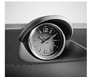
Analoguhr im IWC Design (246)