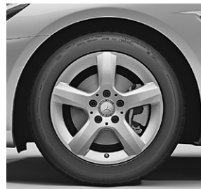
40,6 cm (16") Leichtmetallräder im 5-Speichen-Design (R23)