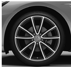
45,7 cm (18") Leichtmetallrad im 5-Doppelspeichen-Design