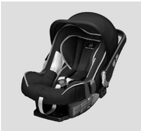
Kindersitz BABY-SAFE plus II