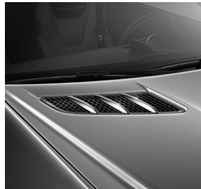
Finnenaufsätze für die Motorhaube